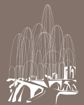
Cripta Gaudí (Colonia Güell)